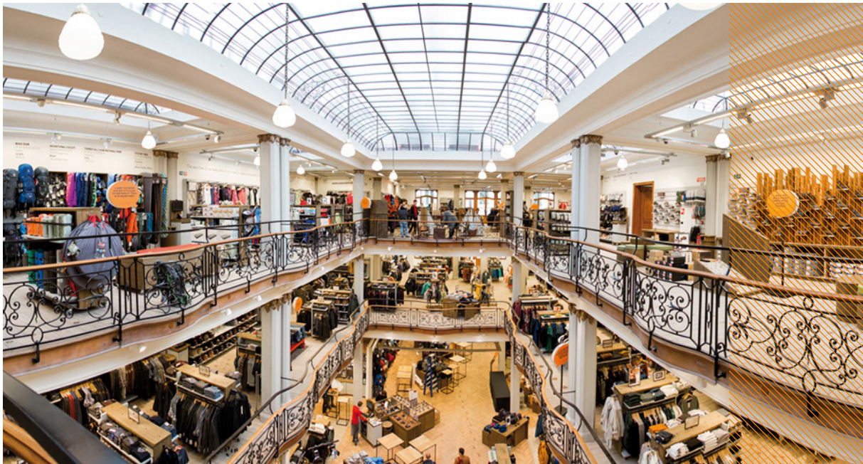
Gent - Zonnestraat 6-8 - AS Adventure

VASTNED RETAIL BELGIUM NV, openbare gereglementeerde vastgoedvennootschap naar Belgisch recht Taco de Groot, Rudi Taelmans of Reinier Walta, tel +32 3 361 05 90, www.vastned.be